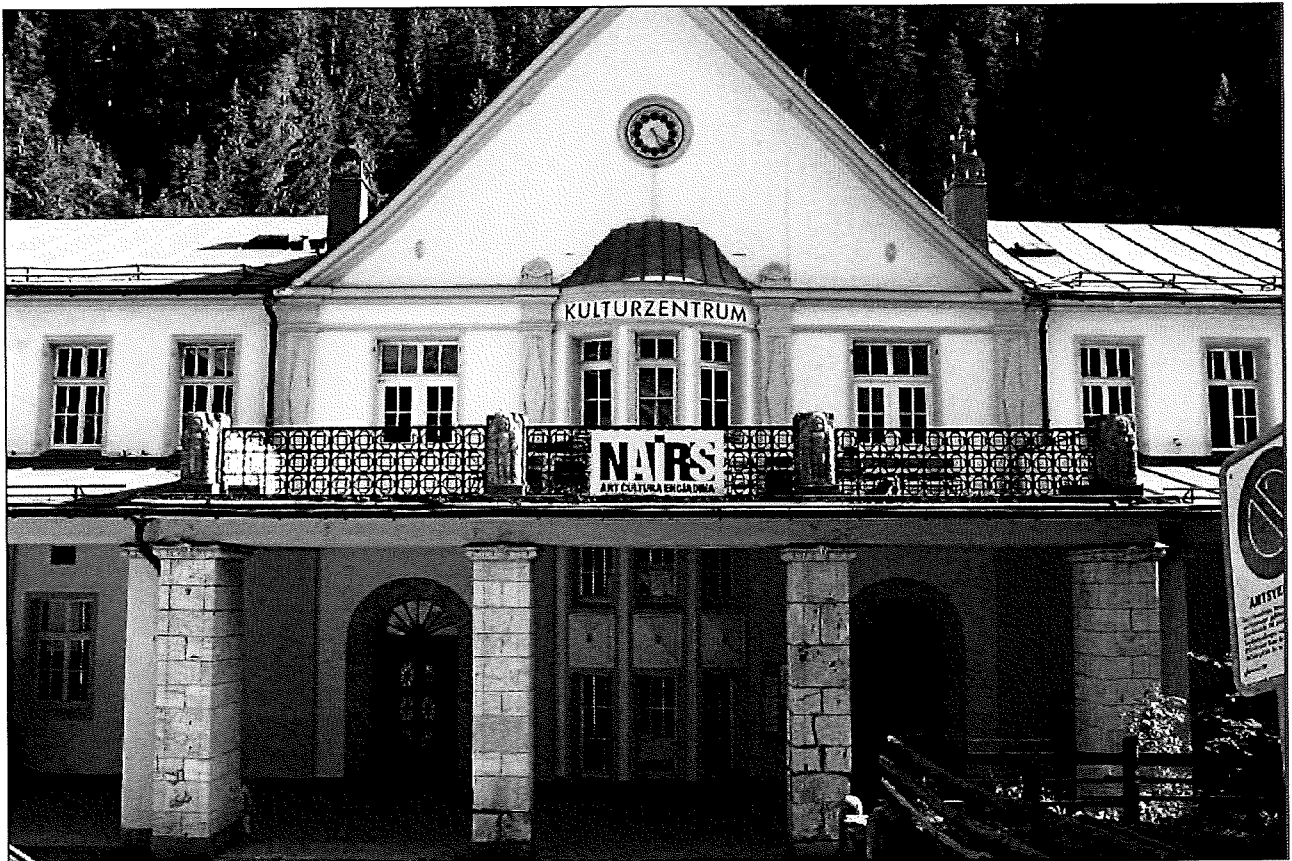
Il Center cultural es a Nairs in stretta vicinanza da Scuol.