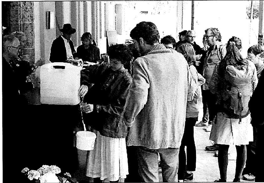
Dürant la stà han lö festas ed occurrenz as chi attiran blera glieud.

Themen-Nr.: 800.004 Abo-Nr.: 1096687 Seite: 1 Fläche: 59'516 mm 2