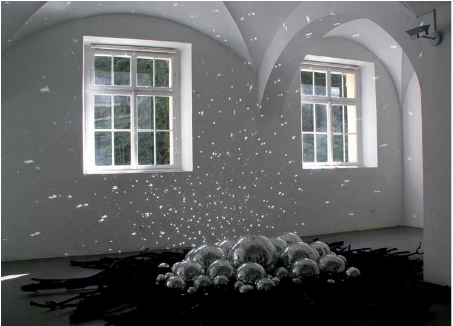
7 NAIRS 2006 : Isabelle Krieg, Nichts verloren